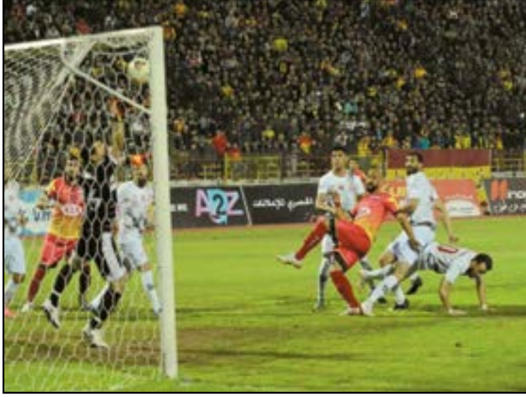
السابقة، وعملها مكمّل لعملهم، والجميع يسعى لتحقيق الإنجاز بتتويج الفريق بلقب الدوري الممتاز.