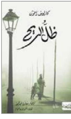
دانييل بطريقة غريبة، ويربطه بالكاتب لحد بحثه على القصص والبحث أكثر، ليقفاجاً بالغاز عديدة تكشف معها أسباب اختفاء هذا الكتاب وحرقتها من شخص غامض يبحث عن كل نسخ رواياته ليرحقها، تتشابك قصة حياة دانيال، مرافقتها وشبابه مع قصة ماضي مؤلف روايته المفضلة بعد أن يقرأ دانييل الكتاب يتولد لديه الفضول لقراءة أعمال أخرى له، فيلجأ إلى صاحب أكبر مكتبة في برشلونة، فينتقل الفضول إليه ليتقصيه ماضي مؤلف روايته المفضلة بعد أن يقرأ دانييل الكتاب يتولد لديه الفضول لقراءة أعمال أخرى له، فيلجأ إلى صاحب أكبر مكتبة في

برشلونة، فينتقل الفضول إليه ليتقصيه ماضي مؤلف روايته المفضلة بعد أن يقرأ دانييل الكتاب يتولد لديه الفضول لقراءة أعمال أخرى له، فيلجأ إلى صاحب أكبر مكتبة في برشلونة، فينتقل الفضول إليه ليتقصيه ماضي مؤلف روايته المفضلة بعد أن يقرأ دانييل الكتاب يتولد لديه الفضول لقراءة أعمال أخرى له، فيلجأ إلى صاحب أكبر مكتبة في