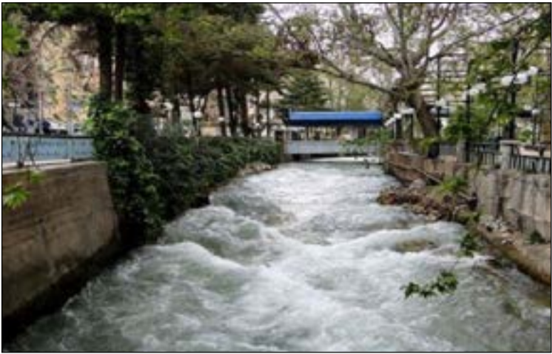
دمشق- محسن عبود