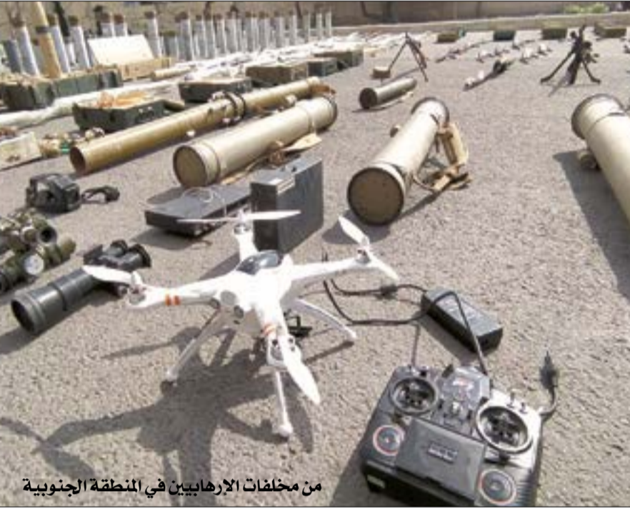
من مخلفات الإرهابيين في المنطقة الجنوبية

الوقت الذي يقدم فيه النظام التركي دعماً للإرهابيين بالمدفعية والصواريخ المحمولة على الكف، في المعارك الدائرة على محور سراقب.