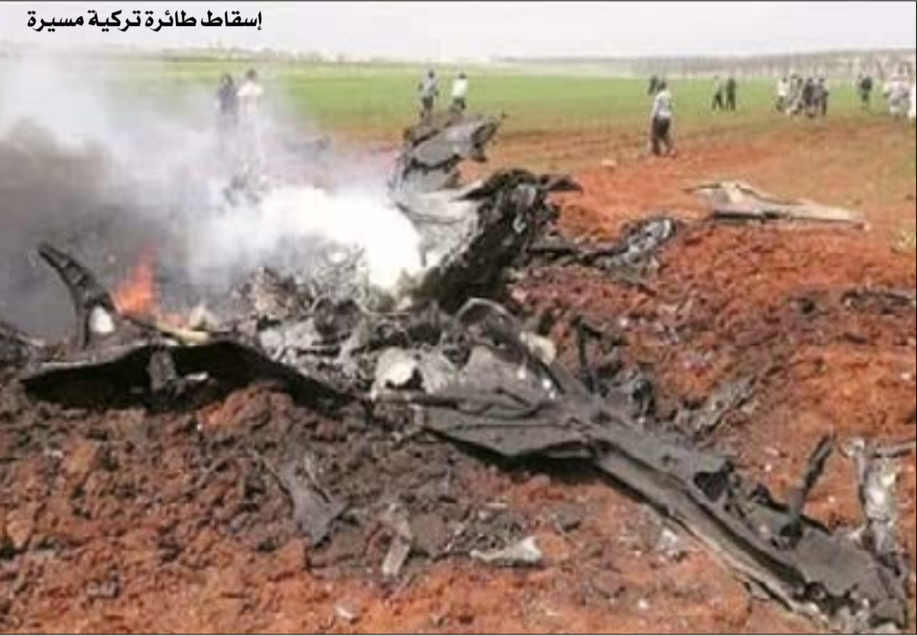
إسقاط طائرة تركية مسيرة

طالبت ٥٤٢ شخصية سياسية وإعلامية وأكاديمية وفنية وحقوقية ونقابية تركية أردوغان بسحب قواته من سورية فوراً، مؤكداً رفضهم لسياساته في إدلب وسورية عموماً.