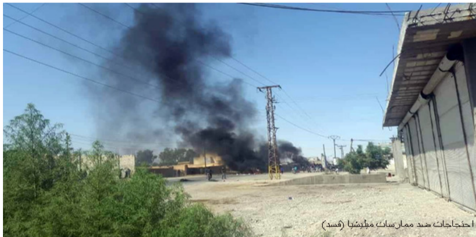
احتجاجات ضد ممارسات ميليشيا (قسد)

ومنذ عدوانها على الأراضي السورية في تشرين الأول من العام الماضي ترتكب قوات الاحتلال التركي ومرترقة من الإرهابيين أعمالاً إجرامية بحق الأهالي وتدمر البنى التحتية والمرافق الخدمية وتتعمد إشاعة الفوضى وممارسة مختلف أشكال الإرهاب بحق الأهالي ما أدى إلى استشهاد وجرح العشرات منهم ونزوح عدد كبير باتجاه مدينتي الحسكة والقامشلي.