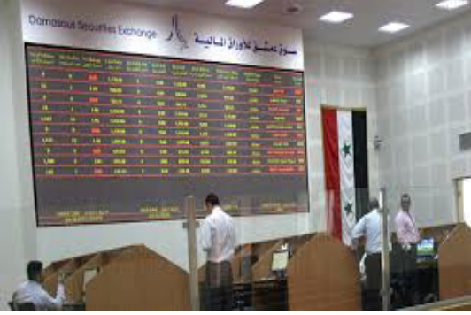
سعر القطع الأجنبي، وذلك لتحسن الوضع الاقتصادي والقوة الشرائية.