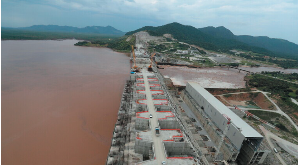
بقضية مشروع "سد النهضة".

ويأتي ذلك قبل ساعات من جلسة في مجلس الأمن، تمت الدعوة إليه اعتراضاً على تنفيذ أديس أبابا للملء الثاني للسد، فيما تقدمت تونس بمشروع قرار يدعو إثيوبيا إلى التوقف عن ملء خزان. ويطالب المشروع كلا من مصر والسودان وإثيوبيا باستئناف المفاوضات تحت رعاية الاتحاد الإفريقي والأمم المتحدة، داعياً الدول الثلاث إلى "وضع نص اتفاق ملزم في شأن السد خلال ستة أشهر، والامتناع عن اتخاذ أي إجراء يعرض عملية التفاوض للخطر"، ويحض أديس أبابا على الامتناع عن الاستمرار في تعبئة خزان السد من جانب واحد.