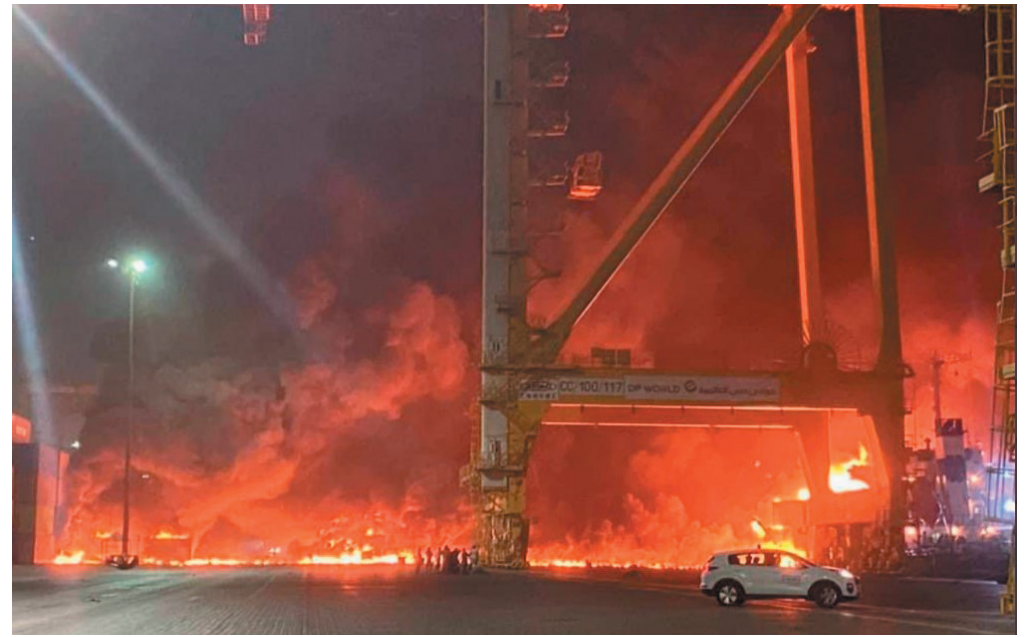
أظهر برنامج تعقب السفن أسطولاً من سفن الدعم الصغيرة المحيطة بسفينة حاويات راسية تسمى "أوشين تريدر" ترفع علم جزر القمر، في موقع حادثة الانفجار في ميناء جبل علي في دبي.

ويصنف ميناء جبل علي بأنه "محور بوابة" و "رابط حيوي في شبكة التجارة العالمية" يربط بين الأسواق الشرقية والغربية. ويقع ميناء جبل علي في الطرف الشمالي من دبي ويخدم البضائع من شبه القارة الهندية وأفريقيا وآسيا. ولا يعتبر الميناء مركزاً عالمياً مهماً للشحن فحسب، بل يمثل أيضاً شريان حياة لدبي والإمارات المجاورة، حيث يعمل كنقطة دخول للواردات الأساسية.