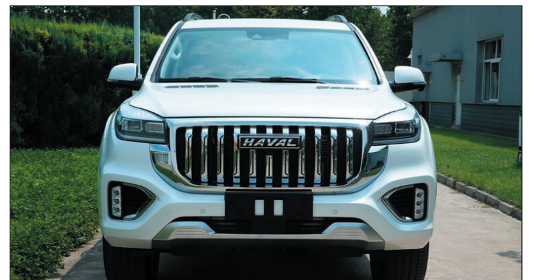
كشفت Haval الصينية عن مركبة H9 الجديدة كلياً التي يرى العديد من المحللين أنها ستكون منافساً قوياً لسيارات Land Cruiser الشهيرة من تويوتا، وتختلف

ويمجرد تقطيع البطاطا إلى الشكل المناسب، يتم سلقها أولاً، ثم يضاف لها خل الشمبانيا الفرنسي، والذي يقول المطعم إن هذه العملية توفر ”طعماً حلواً وحامضاً معاً“ عند اللقمة الأولى، بعد ذلك تُطهى البطاطس في دهن الأوز من جنوب غرب فرنسا، لمنع الغلاف الخارجي ”ملمساً مقرمشاً، وأثناء تحضير البطاطس وقليلها، يقوم طاهي