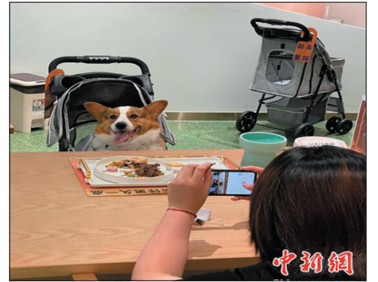
افتتح أول مطعم يقدم الوجبات للحيوانات الأليفة في مدينة شنجهاي في الصين مؤخراً وجذب العديد من

مالكيها، ويقع المطعم في مكان مميز ويطل على منطقة الواجهة البحرية Xuhui على طول نهر شنجهاي، كما أشار القائمون على المطعم إلى أن أصحاب الحيوانات الأليفة قد حجزوا بالفعل طاولات طوال الشهر المقبل. ولا يسمح المطعم بتناول الطعام البشري، ويمكن للبشر فقط مشاهدة حيواناتهم الأليفة وهي تستمتع بطعامهم داخل المكان، وتتضمن قائمة الطعام، أكثر من ٢٠ نوعاً من الأطعمة الحصرية للحيوانات الأليفة وتتراوح أسعار الأطباق من ١٩,٩ يوان إلى ١٩٨ يوان. وهناك أربع فئات من الأطعمة التي يتم تقديمها في