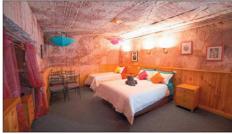
الأرض وكأنها مغامرة في المجهول.

ووفقاً لمجلس مقاطعة كوبر بيدي فهي موطن لنحو ٢٥٠٠ من السكان لكن نحو ٨٠٪ من السكان المحليين بنوا منازلهم داخل الحجر الرملي. وتحتوي المنازل الموجودة تحت الأرض على جميع وسائل الراحة التقليدية مثل الإنترنت والكهرباء والمياه، والفرق الوحيد بين المنازل العادية الموجودة في كوبر بيدي هو أن هذه لا تصلها أشعة الشمس. ولا يمكن الوصول إلى هذه المدينة إلا عن طريق مهبط طائرات صغير، أو بجولة بالحافلة أو بالسيارة الخاصة، وعبر خط سكة حديد غان الممتد بين مدينتي داروين وأديلايد.