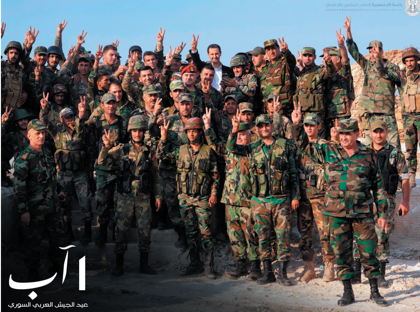
أب عيد الجيش العربي السوري

وأكدت نقابة الفنانين أن الاحتفال بعيد الجيش لهذا العام يأتي وسورية أكثر صلابة ومنعة وإصراراً على متابعة مسيرة الحياة والتطوير بعد أن انتصرت في حرب إرهابية عالمية شارك فيها إرهابيي الأرض مدعومون من دول استعمارية ومستعربة لم يستطعوا النيل من سيادتها وحرية قرارها وهذا الانتصار تحقق بفضل تضحيات رجال الجيش العربي السوري الذي تربى في مدرسة البعث العظيم ومدرسة القائد الحكيم السيد الرئيس بشار الأسد. وأضافت أن ما حققه الجيش العربي السوري من انتصارات تعجز عن تحقيقها أعظم جيوش العالم والتي غيرت معطيات وسيناريوهات الحرب التي نخوضها بكل شرف وثقة وفرضت واقعاً جديداً لم يكن أعداء الوطن بمختلف تسمياتهم ومن يقف وراءهم يتوقعونها فتحريز معظم المناطق التي دخلها الإرهاب ميز هذه المرحلة وجعلها مختلفة عن المرحلة السابقة، وأكدت ما أصرت عليه القيادة السياسية منذ البداية تحرير كل شبر دخله الإرهاب، كما أن هذه الانتصارات أسقطت كل المشاريع الاستعمارية ضد منطقتنا العربية وغيرت خارطة السياسة العالمية وأسقطت الهيمنة العالمية لأمريكا وسمحت بظهور أحلاف وتكتلات عالمية في وجه الغطرسة الأمريكية وأعادت للعالم توازنه. ووجهت النقابة في هذه المناسبة أسمى آيات الشكر والتقدير والتهنئة القلبية لرجال الجيش العربي السوري معاهدتهم أن يبقى الفنانون أوفياء لتضحياتهم وأن يجسدوا بطولاتهم أعمالاً ترتقي إلى حجم هذه التضحيات ويعاهدون السيد الرئيس بشار الأسد أن يبقوا خلف قيادته الحكيمة.