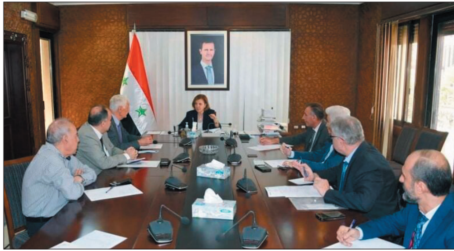
حلب عضو مكتب التنفيذي في اتحاد الكتاب العرب.

وكانت إدارة معرض الكتاب السوري ٢٠٢١ قد دعت السادة الناشرين والمؤسسات الرسمية والوزارات والجامعات والمعاهد الخاصة السورية إلى تقديم طلبات الاشتراك في المعرض في الفترة ما بين ٢٠٢١/٩/١٣ ولغاية ٢٠٢١/٩/٢٠.