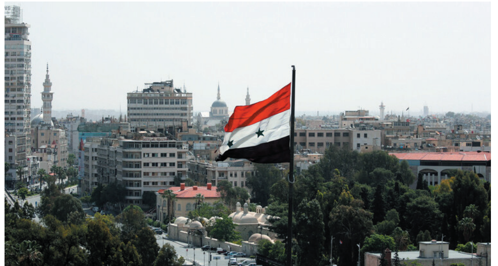
جددت القيادة القطرية لحزب البعث العربي الاشتراكي في اليمن تضامنها مع سورية في حربها وأدواتهم في المنطقة.

كما أعرب البيان عن تمسك القيادة القطرية بالثوابت الوطنية ووحدة اليمن انطلاقاً من فتح قنوات الحوار والمساواة في الحقوق والواجبات كضرورة حتمية لإنهاء العدوان والحصار على البلاد وإعادة الإعمار.