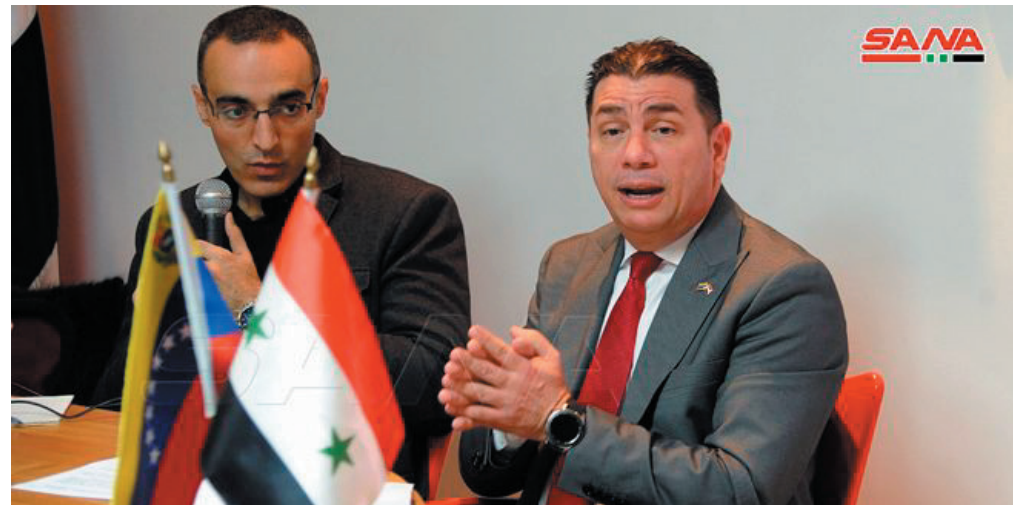
أكد القائم بالأعمال في السفارة الفنزويلية خواكين غوميز عمق علاقات الصداقة الفنزويلية السورية، مشيراً إلى ضرورة التضامن والتعاون بين كل الدول الحرة.

وفي تصريح على هامش ندوة خاصة حول الانتخابات البلدية والمحلية الفنزويلية التي جرت في الـ ٢١ من الشهر الماضي أقامتها السفارة الفنزويلية بدمشق، قال غوميز: أن ما يربط فنزويلا مع سورية الصداقة والتعاون على المستوى الدولي ففي أصعب الأوقات كانت من الدول التي رفعت الصوت عالياً لرفض أي قرار يتناقض مع حقوق الشعب السوري لذلك فإن تبادل المعلومات حول الحقائق التي تجري في كلا البلدين مهم جداً لأن هذا الدعم يكون قويا عندما يكون مؤسساً على الحقيقة. وعن الانتخابات الفنزويلية، ذكر غوميز أن تبادل الحقائق والأرقام حول الانتخابات مع المجموعات والروابط التي تدعم فنزويلا تأكيد على نزاهة العملية الانتخابية والنظام الانتخابي في فنزويلا، مبيناً أن المرشحين المنتمين للأحزاب السياسية التي تدعم الحكومة الوطنية حققوا فوزاً بـ ١٨ ولاية و٢٠٥ رئاسة بلدية ورافق العملية الانتخابية نحو ١٦٢ مراقباً دولياً