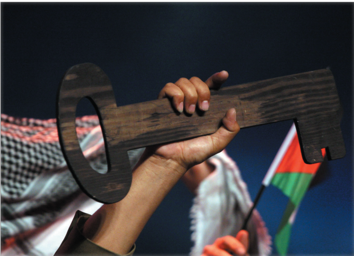
البعث الاسبوعية - هيفاء علي

في هوليوود، هناك شيء واحد نادراً ما يتم الحديث عنه في المناقشات السياسية في الردهات، حتى أنه يتم إخفاؤه عن قصد هو أمر يتم الحديث عنه سراً ويصوت خافت ولا يتم التنديد به علناً، إلا من قبل أولئك الشجعان بما يكفي لتحمل العواقب المؤلمة لدعمهم للشعب الفلسطيني والأمتلة كثيرة عن الشخصيات التي طالتها الاتهامات الباطلة بمعادة السامية، التي عطلت أو قاطعت أو دمرت حياتهم تماماً. ومع ذلك فإن هذه الشخصيات لم تضع نفسها إلا في الجانب الصحيح من التاريخ