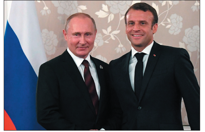
أكد الرئيس الروسي، فلاديمير بوتين، في مستهل لقاء مع نظيره الفرنسي، إيمانويل ماكرون، في الكرملين، اليوم الاثنين، أن لروسيا وفرنسا مباحث قلق مشتركة في مجال الأمن.

وصرح: "كما قلت تشارك فرنسا بانشط شكل في حل القضايا المحورية