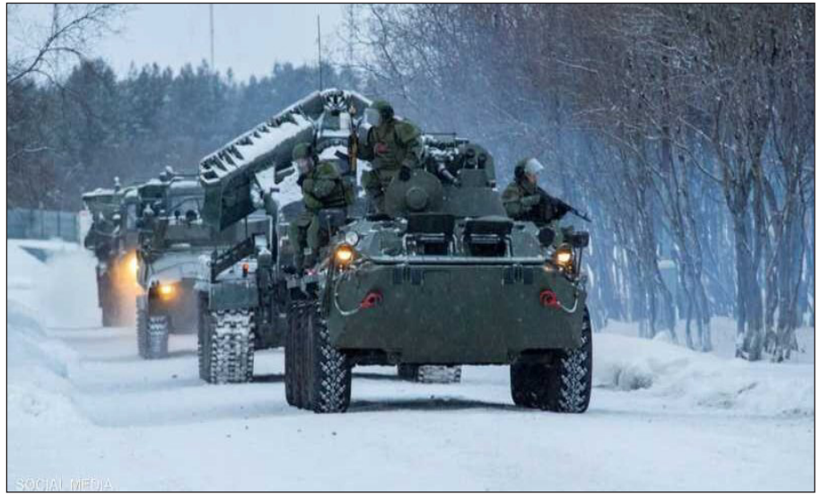
سياسية حول أوكرانيا.

إلى ذلك، حذر نائب وزير الخارجية الروسي ألكسندر غروشكو من أن بعض الدول تحاول جرّ منظمة الأمن والتعاون في أوروبا إلى تلاعبات