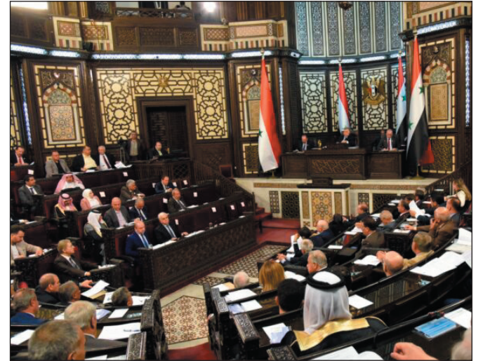
عقد مجلس الشعب اليوم جلسته الرابعة من الدورة العادية السادسة للدور التشريعي الثالث برئاسة حموده صباغ رئيس المجلس.

وأضاف البيان: "هم بنو صهيون ومرترقتهم من التنظيمات الإرهابية.. قتلة الأنبياء والقديسين.. سفاحو العصر الحديث.. وجه الإرهاب البشع.. ولا عجب