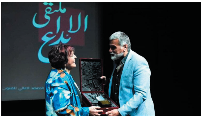
سعد الله ونوس كاتب مسرحي عالمي

وأوضحت الأشقر أنها اختارت المسرح من بين كل الفنون في مسيرتها لإيمانها بأنه فن التغيير، ولانحيازها للعمل الجماعي المجتمعي، حيث المسرح هو الفن الوحيد الذي يلتقي فيه الجمهور والممثل، إضافة إلى ما يتمتع به من روحانية ليست موجودة لا في التلفزيون ولا في السينما، مع اعترافها أن خيارها للمسرح كان أصعب خيار لأنه يحتاج إلى تضحية كبيرة، مشيرة كمرحلة تسمتق بالإخراج إلى أنه من الخطأ أن يُمثل المخرج عندما يكون مخرجاً لأن الإخراج عملية بناء للعمارة، والمخرج يجب أن يكون حاضراً وموجوداً داخل هذا البناء وخارجه، لذلك فهي تفضل أن تكون إما ممثلة أو مخرجة، ولا يمكن أن تجمع المهمتين معاً، مؤكدة أنها كمرحلة لا تعتمد على الديكور والسينوغرافيا في أعمالها المسرحية، فكل ما يشغلها هو الممثل على خشبة، أما الديكور فهو يُحدّد وفقاً لحركة الممثل وما يحتاجه، أما الأزياء فقد أكدت أنها لا تعيق الممثل على المسرح لأنها جزء أساسي في بناء الشخصية ويجب أن يتعامل معها الممثل كجزء منه على خشبة المسرح، مبيّنة أن المسرح ليس صورة طبق الأصل عن الحياة بل يجب أن يُقدّم حياة أخرى وعالم آخر، إلا إذا قرّر أصحابه أن يكونوا واقعيين، وأكثر ما تكره هو الإسفاف في المسرح، مشيرة إلى أن المسرح في العالم العربي ينحسر ويتراجع، وأنه يرتكز على حرية التعبير والجسد، فمسرح دون انطلاق وحرية تعبير لا يمكن أن يكون مسرحاً، كما دعت الفنانين السوريين الذين يتألقون في الدراما التلفزيونية إلى العودة إلى المسرح وأن يستفيد المسرحيون من الخبرة الإنسانية العميقة المؤلدة التي ولدتها الحرب القاسية على سورية ليستخدموها في المسرح بشكل واقعي أو عبثي، وأنه من واجب المسرحيين أرشفة هذه الأحداث وتقديمها مسرحياً.