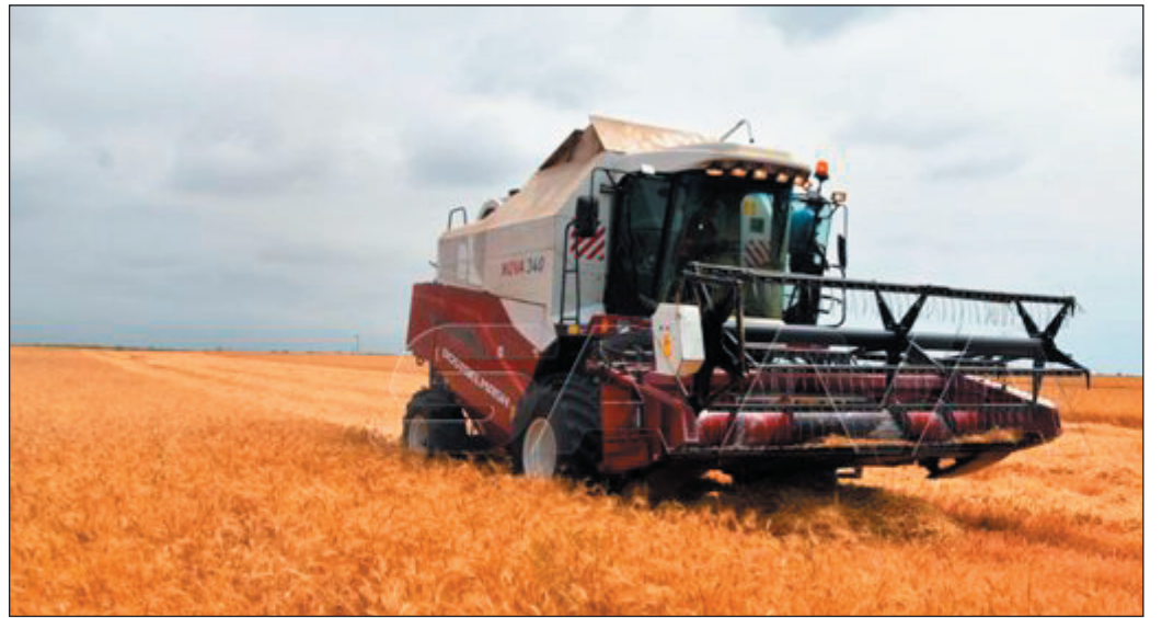
أكد وزير الزراعة والإصلاح الزراعي المهندس محمد حسان قننا أن المواصفات الفنية لمحصول القمح في محافظة طرطوس جيدة جداً وأن الآلية المتبعة في استلام المحصول من المزارعين وفق تنظيم الدور لاقت

ارتياحاً لديهم لجهة السعر وإجراءات التسليم. جاء ذلك خلال جولة للوزير قننا في المحافظة للاطلاع على واقع تسويق محصول القمح حيث أشار في تصريح للصحفيين من مركز الاستلام بقرية العنابية بريف المحافظة إلى أن هدف الجولة هو لقاء الفلاحين في حقولهم والاطلاع على واقع تسويق القمح والاجراءات المتخذة بهذا الشأن. وشملت الجولة مكتب الحمضيات بالمحافظة للاطلاع على أعمال تأهيله إلى جانب لقاء الفلاحين في حقول القمح وبساتين الحمضيات والزيتون والبيوت البلاستيكية في عدة قرى بريف المحافظة. إلى ذلك عقد الوزير قننا اجتماعاً مع الأسرة الزراعية في مبنى مديرية الزراعة بالمحافظة تم خلاله مناقشة الأطر التنفيذية والسياسات الواجب تطبيقها في المرحلة القادمة عبر الاعتماد على تأسيس مشاريع استراتيجية خاصة لكل محافظة واختيار مجموعة من القرى التنموية والتصديرية ووجود محاصيل استراتيجية تبني عليها مشاريع