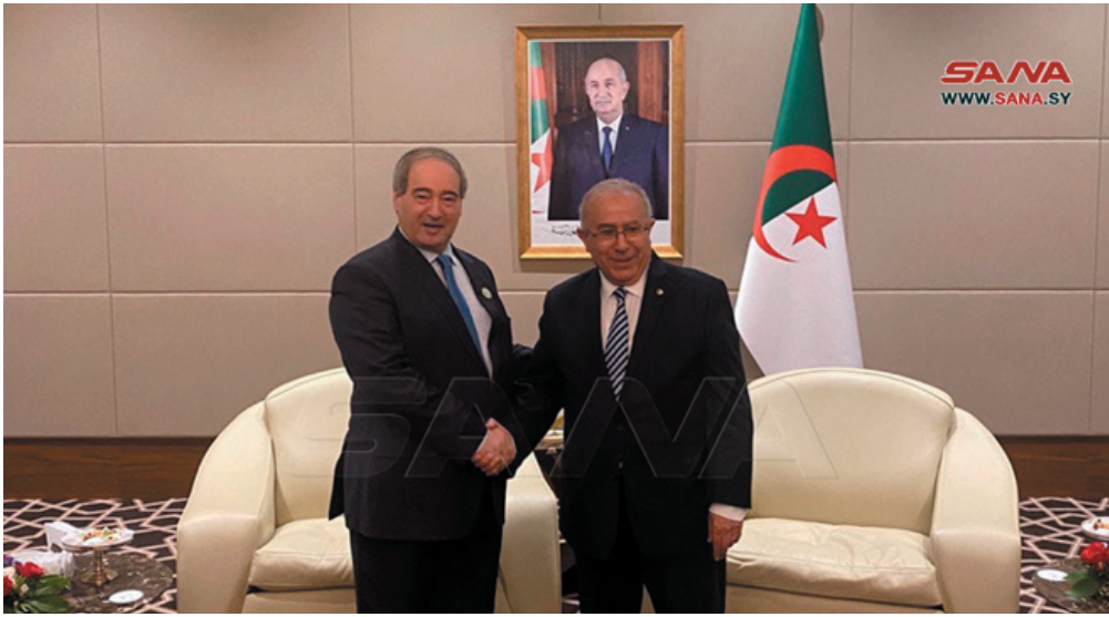
ذات الاهتمام المشترك على الأجندة الثنائية والدولية. الجزائرية للمشاركة في احتفالاتها بالذكرى الستين ويزور وزيراً الخارجية السوري والكوبي العاصمة لعيد الاستقلال.