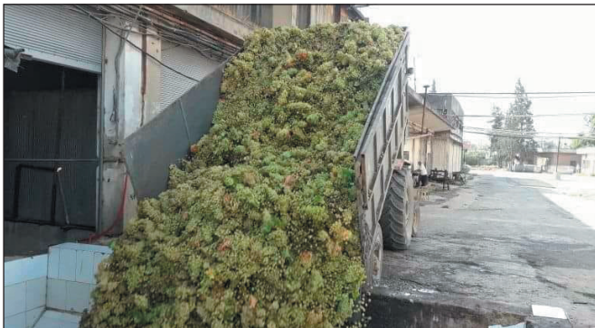
بالقنيطرة نحو (٣٦٥٥) طناً.