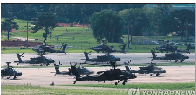
الأول من أيلول القادم.

جددت الصين دعوتها للولايات المتحدة إلى العودة إلى احترام مبدأ "صين واحدة"، والتوقف عن الإدلاء بتصريحات واتخاذ إجراءات ضارة بمصالحها الأساسية عبر تصعيد الموقف حول تايوان الصينية. وقالت الوزارة الخارجية في بيانها اليوم: إن التصريحات ذات الصلة التي أدلى بها السفير الأمريكي