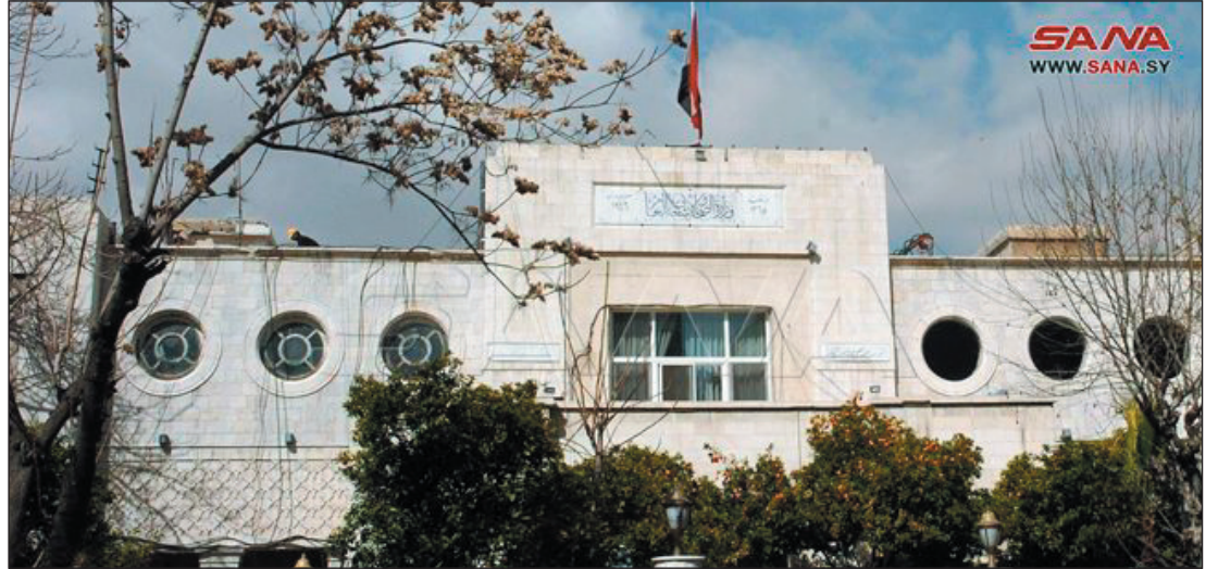
حلب / معن الغادري