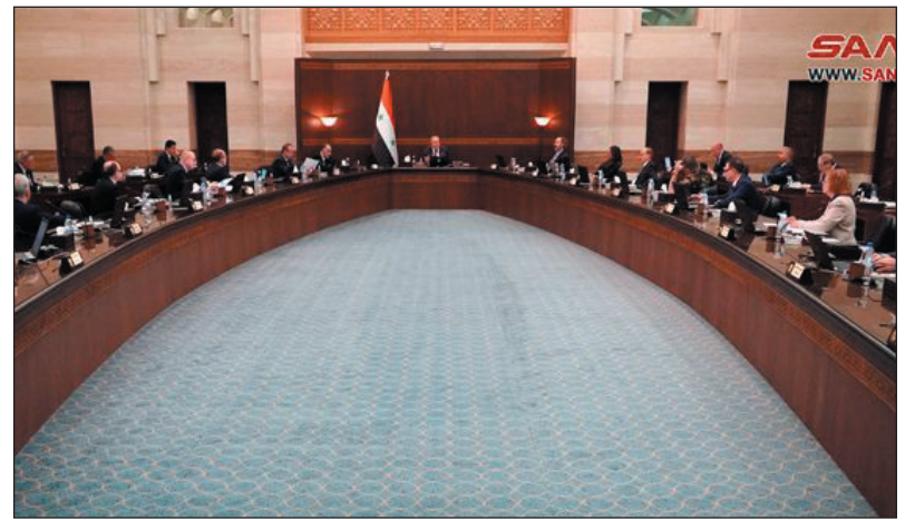
دمشق - سانا

والأجور والتعويضات بنحو ٢١١٤ مليار ليرة، بزيادة ٣٣ بالمئة عن موازنة عام ٢٠٢٢. وأطلع المجلس خلال جلسته الأسبوعية اليوم برئاسة المهندس حسين عرنوس على عرض حول نتائج زيارة الوفد الحكومي إلى مدينة معرة النعمان مؤخراً، بما يضمن تسهيل عودة الأهالي إلى منازلهم، ووافق المجلس على الخطة التي أعدها الوفد لإعادة الخدمات إلى المدينة، وتتضمن استكمال إزالة الأنقاض وتأهيل المركز الصحي ودراسة تأهيل المشفى الوطني، والبدء بتأهيل أربع مدارس، وإعادة تأهيل المخبز الآلي، وتجهيز صالات التدخل الإيجابي، والبدء بصيانة شبكات مياه الشرب والصرف الصحي، وتجهيز خط كهرباء من خان شيخون بطول ٢٧ كيلومتراً، وتأمين ٥ مراكز تحويل كهربائي، ودراسة صيانة مجلس المدينة والجمع الحكومي، وترميم وتجهيز سوق الهال، والبدء بتأهيل البنى التحتية في المنطقة الصناعية والحرفية، وتحسين شبكة