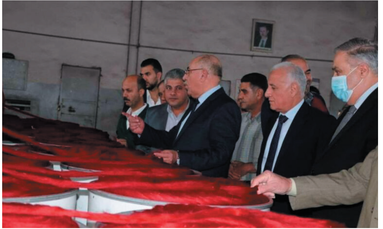
حماة - حسان المحمد اطلع وزير الصناعة زياد صباغ، على واقع الشركات والمعامل التابعة للوزارة كالشركة والخياط القطنية وملحج العاصي ومعمل التبغ، إذ أشاد الوزير صباغ بالجهود التي