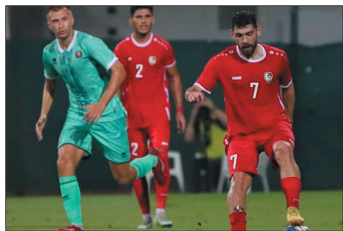
عليه ألا يحقق نصف المطلوب منه.

مع بيلاروسيا للأسف أضعنا فوزاً كان بمتناول اليد، فلعب منتخبنا طوال المباراة متراجعاً إلى الخلف تاركا المنتخب المنافس يسرح ويمرح كيفما يشاء، وعندما تأخرنا بهدف أعطى مدربنا الأذن لمنتخبنا بالهجوم فقدم عشر دقائق جميلة وسنحت له ثلاث فرص للتسجيل أبطل مفعولها حارس بيلاروسيا، وهذا يدل على أن منتخبنا كان لديه شيء ليقدمه لكن هناك من يفرضه! لا ندري كيف سيكون شكل المنتخب اليوم مع فنزويلا، الخسارة قد لا تكون مهمة، لكن المهم شكل المنتخب وأدائه ومستواه، وبكل الأحوال بعد هذا المعسكر نعتقد أن تجربة الاستعانة باللاعبين المحليين فشلت ولم تحقق المطلوب منها، ومن المؤكد أن منتخبنا الذي يستعد للنهائيات الآسيوية يجب أن يجد الحلول الناجعة من اتحاد كرة القدم، فالخشية إن استمر الوضع على ما هو