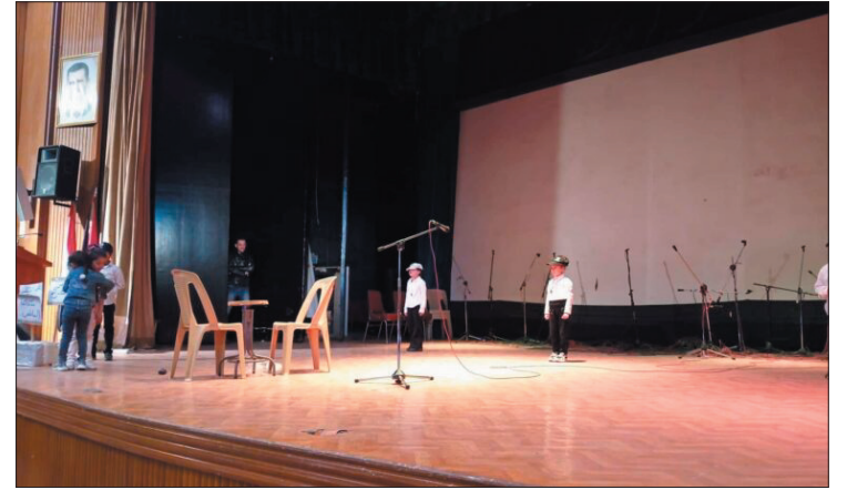
درعا - دعاء الرفاعي

وتضمنت الفعاليات قراءة نصوص أدبية حملت عناوين "قطرة الإنسان سعادته"، و"أوقات لا تبقى" وتقديم عروض غنائية متنوعة، وعرض لوحات فنية من رسم المواهب الشابة المشاركة.