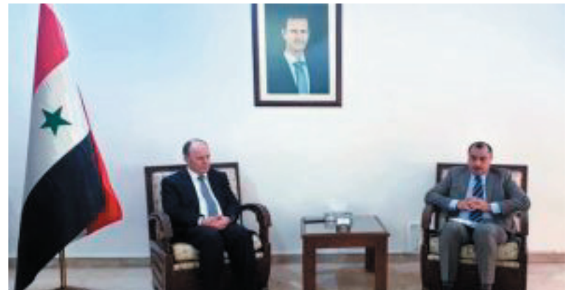
التشيلية بدمشق خوسيه باتريسيو بريكل أفاق التعاون العلمي والبحثي والثقافي المشترك وسبل

تطويرها. وأكد الوزير إبراهيم استعداد الوزارة لإقامة تعاون علمي بحثي مشترك مع الجانب التشيلي وترجمته ضمن برنامج زمني تنفيذي، من خلال أهم الجامعات في البلدين، ولا سيما في الاختصاصات الدقيقة المتعلقة بالموارد المائية والطبيعية، منوهاً بالمستوى العلمي الذي تتمتع به