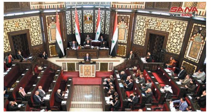
دمشق - سانا:

وفي مداخلاتهم، طالب عدد من أعضاء المجلس بزيادة الدعم المقدم للقطاعات الإنتاجية وتشجيع الاستثمار في مجال الطاقات المتجددة وتحسين المناخ