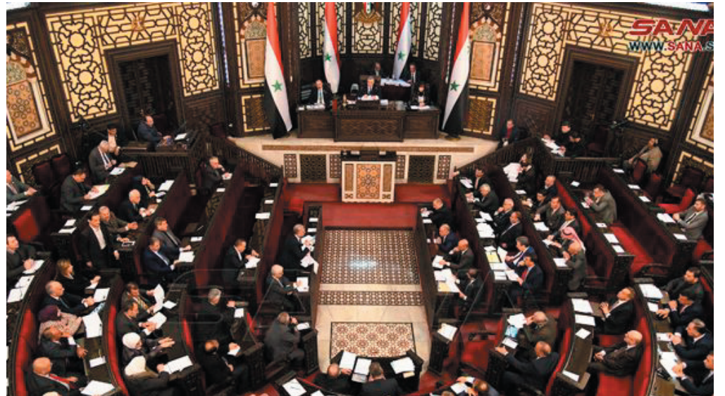
دمشق - سانا:

رقم ٤٤ لعام ٢٠٠٥ وتعديلاته الخاص برسم الطابع. ويعد تلاوة تقرير لجنة القوانين المالية حول مشروع القانون تم طرحه للمداولة العامة، حيث رأى عدد من الأعضاء أن التعديلات تُسهم في تحقيق العدالة بين الإدارة الضريبية والمكلفين ومكافحة التهرب الضريبي