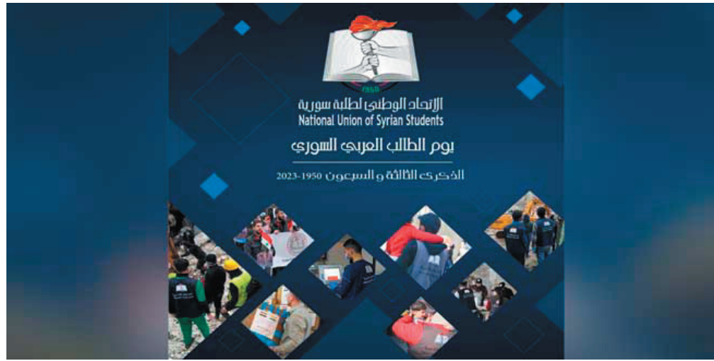
لسورية القوية بشعبها الأبي وجيشها البطل وقائدها السيد الرئيس بشار الأسد.

مجموعة نوعية من الفعاليات الطلابية من وحي الحدث الذي كان لطلبة سورية فيه حضورهم الكبير في التخفيف من تداعيات كارثة الزلزال المدمر الذي ضرب بلدنا في الـ ٦ من شباط الماضي. وأوضح الاتحاد أنه سيتم بمناسبة هذه الذكرى تكريم الطلاب المشاركين في العمل التطوعي في المحافظات المنكوبة، الذين ساهموا في إزالة الأنقاض وتقديم الإسعافات، والتطوع في المشافي، والتبرع بالدم، وفي مراكز الإيواء والإطعام والمطابخ الميدانية، ونقل المساعدات في المطارات، وجلسات الحوار والدعم الاجتماعي والوقفات التضامنية الشجاعة في فروع الاتحاد الخارجية، إضافة إلى عرض فيلم وثائقي يلخص مجمل الأعمال والنشاطات التي شهدتها هذه الحادثة الأليمة. وأكد الاتحاد في ختام البيان أن طلبة سورية سيقفون مشاعل علم في ميادين التعليم والعمل ورجال فكر وحوار وابتكار وريادة وتميز في حقول المساهمات العلمية ومنصات التتويج، متسلحين بالوطنية والإخلاص والانتماء