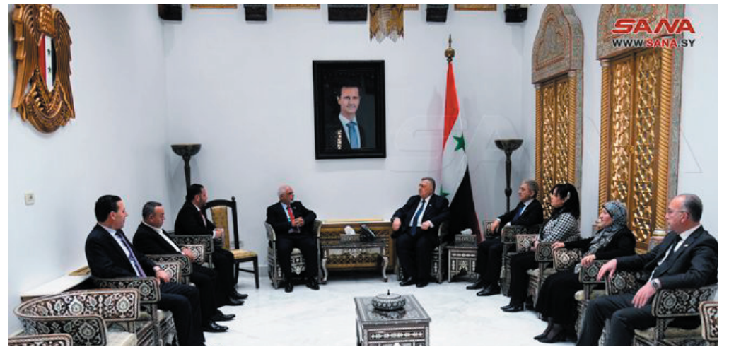
لقائه اليوم السفير المفوض فوق العادة لكوبا لدى سورية لويس ماريانو فرنانديس، أهمية تعزيز العلاقات

من جانبه، أكد السفير الكوبي أن بلاده كانت وما زالت تقف إلى جانب الشعب السوري في حربه ضد الحصار والعقوبات والإرهاب وداعميه ومموليه، مشيراً إلى أن كوبا ما زالت تعانِي العقوبات الظالمة