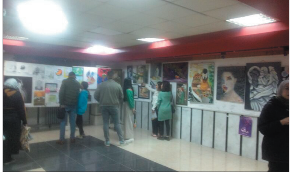
الذي يقيمه مشروع مدى الثقافي بالتعاون مع مديرية ثقافة حمص في صالة المعارض بدار الثقافة، ويشترك

فيه عدد من الفنانين المحترفين تشجيعاً للمواهب الشابة المشاركة، وتقديراً للطاقات الإبداعية الكامنة فيما يقدمونه من فن راق يتناول جوانب مختلفة في حياتنا تعبر عن ثقافة فنية وأعدة يمكن الاشتغال عليها لتعزيز الجوانب الحضارية الخلاقة التي يحملها الفن التشكيلي في دلالاته المادية والمعنوية. يأتي هذا المعرض استكمالاً لمشروع فني ثقافي يشغل عليه مشروع مدى لتسليط الضوء على مواهب فنية وأعدة ومد يد الاهتمام إليها لإخراجها إلى النور وصقل تجاربها مستعيناً بتعاون مشجع لفنانين محترفين. ويعتبر المعرض تظاهرة فنية حقيقية يضم عدداً كبيراً من المشاركات الجديدة إلى جانب لوحات سبق لها وأن شاركت في معارض سابقة ولافت استحساناً من زوار المعرض والمهتمين بالشأن الثقافي والفني في محافظة حمص. تتناول اللوحات المشاركة مواضيع مختلفة توزع بين المدرسة التسجيلية التي تبرز معالم الجمال في الطبيعة وفن العمارة القديم وارتباطها الحميمي مع الإنسان، حيث استحضار التاريخ بواقعيته المتمثلة في معالم عمرانية ذات طابع جمالي ماديا وإنسانا، كما تستحضر بعض اللوحات الميثولوجيا الشعبية، ولاسيما تلك التي