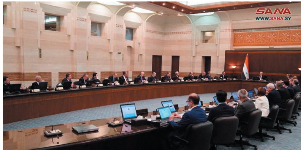
دمشق - سانا:

وفي هذا السياق قدم وزير الإدارة المحلية والبيئة المهندس حسين مخلوف رئيس اللجنة العليا للإغاثة