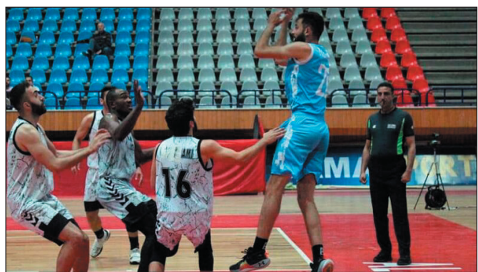
وشدّد خليل على أن الفريق بلاعبيه وكادره الفني مصمّمون على الفوز لإسعاد الجمهور الذي كان مسانداً للنادي في أصعب الظروف.