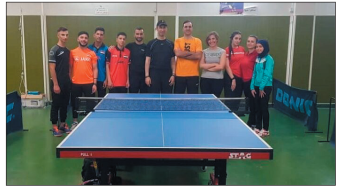
انطلقت تدريبات منتخبنا الوطني لكرة الطاولة الذي يستعدّ للمشاركة بالدورة العربية المقرّرة في الجزائر للإناث، والبطولة العربية للذكور بإشراف