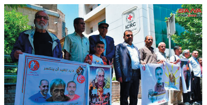
دمشق - سانا

ولفت المشاركون إلى أن الأسير دقة البالغ من العمر 61 عاماً يعاني من مرض خطر هو سرطان النخاع الشوكي الذي تم تشخيصه في كانون الأول