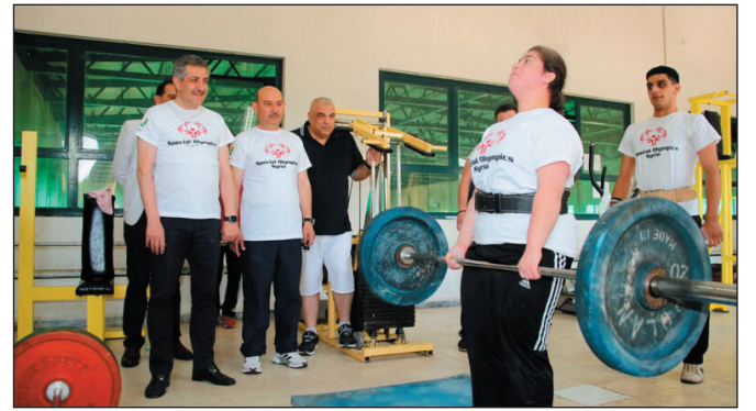
تواصل على ملاعب نادي الجيش في دمشق تحضيرات واستعدادات منتخبنا للأولمبياد الخاص للمشاركة في دورة الألعاب العالمية الصيفية التي