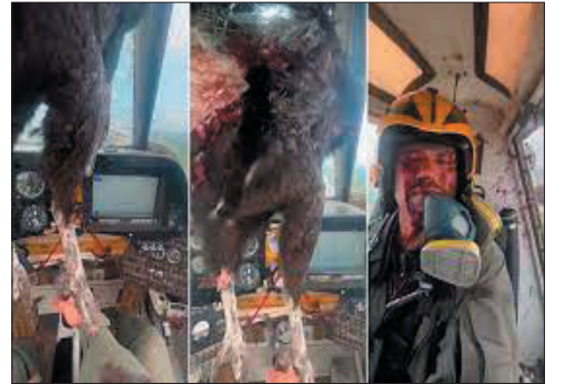
تفاجأ طيار وهو يحلق في سماء مدينة فينيس بمقاطعة لوس ريوس بالإكوادور بارتطام طائر بالزجاج

وعادة ما تشكل ضربات الطيور تهديداً كبيراً لسلامة الطيران، ويمكن أن تؤدي إلى إصابات بشرية. وبحسب دراسة نشرها موقع ”سمبل فلاينغ“