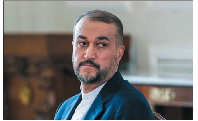
طهران - سانا

والشرطة في فرنسا إلى ضبط النفس ونبذ العنف، واحترام مبادئ الكرامة الإنسانية والاحتجاج السلمي والاهتمام بمطالب المحتجين. وقال كنعاني في تصريح اليوم: إن ممارسة التمييز ضد المهاجرين وعدم تقبلهم وعدم تصحيح التعامل الخاطئ معهم من بعض الدول الأوروبية، أدى إلى خلق أوضاع غير مناسبة للمواطنين الأوروبيين ولاسيما في فرنسا. وشدد كنعاني على ضرورة احترام الحكومة الفرنسية مبادئ الكرامة الإنسانية، وحرية التعبير وحق الاحتجاج السلمي للمواطنين، ووقف التعامل التعسفي مع مواطنيها. ونصح كنعاني الرعايا الإيرانيين بتجنب السفر غير الضروري إلى فرنسا قدر الإمكان في ظل الأوضاع المتأزمة الحالية، داعياً رعايا إيران المقيمين في فرنسا إلى تجنب التردد غير الضروري إلى المدن، والمناطق التي تشهد احتجاجات بسبب الأوضاع غير الآمنة في فرنسا التي لا يمكن التنبؤ بها. وفي شأن آخر، أعلن وزير الخارجية حسين أمير عبد اللهيان وقف إرسال سفير إيران الجديد إلى السويد في الوقت الراهن بسبب الإساءة للقرآن الكريم. وقال عبد اللهيان في حسابه على موقع "تويتر": "بالأمس تحدثنا بالتفصيل مع