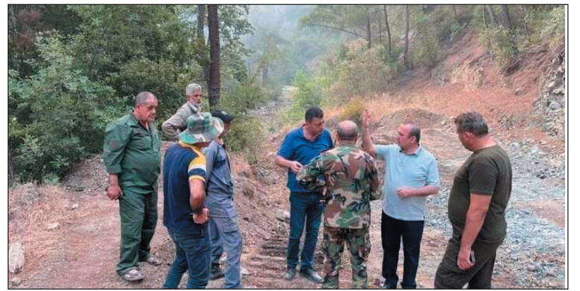
الحرائق المندلعة في المساحات الحراجية بين مشقينا والسرسكية في ريف اللاذقية

مع استمرار وصول المؤازرة من المحافظات للمساعدة في السيطرة على بؤرة الحريق الضخم الذي شق منذ الأمس في مناطق حراجية هي الأجل محولاً مساحات واسعة منها إلى رماد بفعل آلسنة اللهب والنار التي استعرت بقوة بفعل الظروف التضاريسية والمناخية بفعل سرعة اهبوب لرياح والطبيعة الجبلية لهذه المواقع ما تسبب في اتساع رقعة النيران وامتدادها على مساحات واسعة، في وقت اندلع حريق آخر في نطاق بلدة ربيعة وفي مناطق على تماس مع التنظيمات الإرهابية. وفي مواجهة هذه الكارثة الدامية والمأساة المريرة تم زج كل وسائل منظومة الإطفاء بمشاركة حوامات