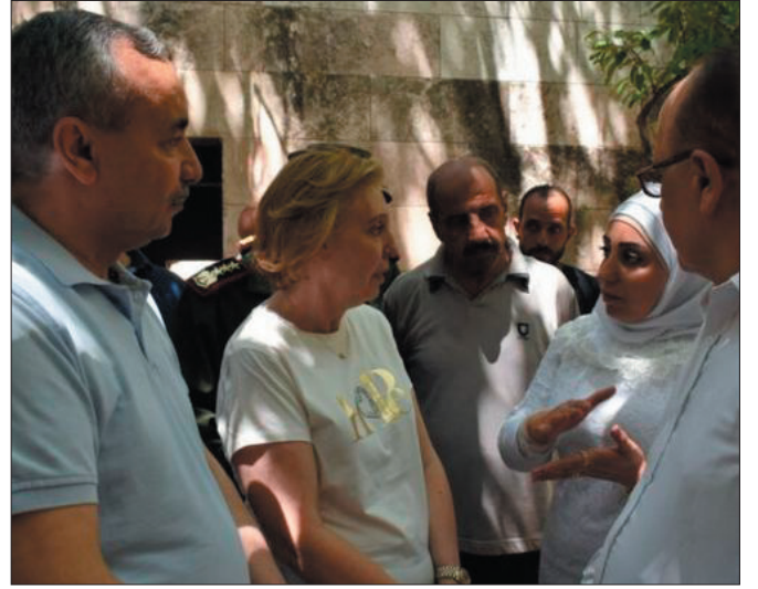
حماة - حسان المحمد

وبينت وزيرة الثقافة في تصريح لها أن الوضع الحالي لمتحف معرة النعمان مرض بشكل عام رغم محاولات التعرض له والعبث به ومحاولة سرقة محتوياته، لكن الجهد الكبير الذي قدمه عمال الآثار والمتاحف جنباً إلى جنب مع مواطني وسكان المنطقة الذين حركتهم الغيرة على تراثهم، أدى لحماية المتحف نوعاً ما. يذكر أن المديرية العامة للآثار والمتاحف وبالتعاون مع دولة عمان الصديقة والشقيقة أعادت توثيق كافة القطع المتحفية في متحف معرة النعمان وغلفتها ونقلتها، وتعمل الآن على إعادة تأهيل وترميم هذا المتحف الذي له أهمية تاريخية كبرى وأهمية مرتبطة بمقتنياته وخاصة اللوحات الفسيفسائية المشهورة عالمياً، بالإضافة لساحة المعرة التي احتضنت تماثيل