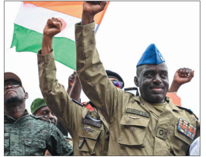
نيامي - وكالات

في حال رفض السفير الفرنسي مغادرة البلاد، وذلك مع قرب انتهاء مهلة ٤٨ ساعة التي منحتها إياها السلطات. يأتي ذلك، بعدما أعلن المجلس الوطني لحماية الوطن في النيجر، طرد السفير الفرنسي سيلفان إيتي لعدم استجابته لدعوة من وزارة الخارجية من أجل مقابلة، بالإضافة إلى "تصرفات أخرى من الحكومة الفرنسية تتعارض مع مصالح النيجر"، فيما رفضت فرنسا مطالبة السلطات العسكرية في النيجر، بمغادرة سفيرها متدرة بأن "الإنقلابيين ليست لهم أهلية" لتقديم طلب كهذا. إلى ذلك، تستمر التظاهرات الشعبية في النيجر المطالبة برحيل القوات الفرنسية عن البلاد وإنهاء التعاون مع فرنسا على جميع المستويات. كما احتشد أنصار العسكريين في ملعب سيني كونتشي، الأكبر في البلاد، ملوحين بأعلام النيجر والجزائر وروسيا في المدرجات. وتعهّد المجلس العسكري الانتقالي في النيجر، أمام حشد من نحو ٢٠ ألف نيجري بمواصلة النضال للوصول إلى "اليوم الذي لن يكون فيه هناك أي جندي فرنسي في البلاد".