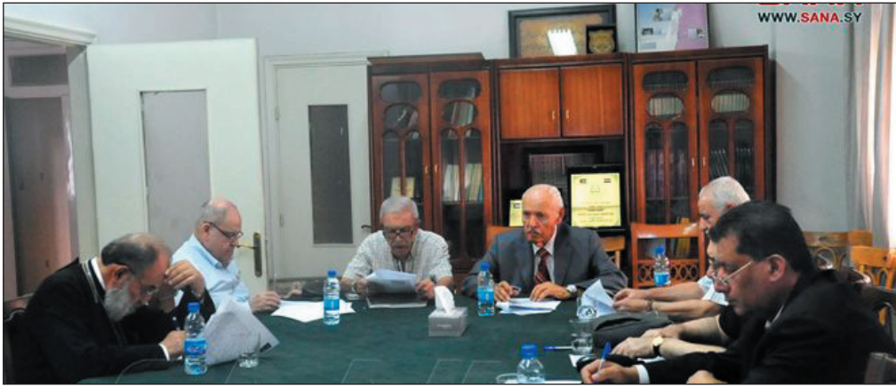
يذكر أن اللجنة التي تأسست عام ٢٠٠١ بعد الانتفاضة الثانية في الأراضي المحتلة، وتعمل على تقديم المساعدات الإنسانية من الشعب السوري إلى أشقائه الفلسطينيين في الأراضي المحتلة.