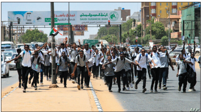
وأشار وزير التعليم السوداني إلى أن استئناف الدراسة ليس أمراً سهلاً، ولكنه يتطلب إعادة إعمار البنية التحتية بعد انتهاء الصراع في البلاد.

الخرطوم، وأيضاً ما تعرض له طلاب الشهادة السودانية الذين كانوا على استعداد لأداء الامتحانات، وهو ما عرض التقويم الدراسي لخلل نتيجة للحرب، ولكن ثمة مساعٍ لتوفير الحلول المناسب.