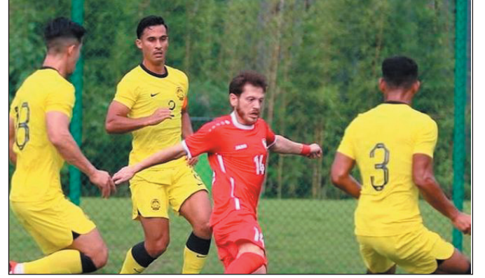
فشل منتخبنا الوطني لكرة القدم بتحقيق فوز كان سهلا وبمتناوله على منتخب ماليزيا في مباراته الودية الأولى في معسكره الخارجي في الصين