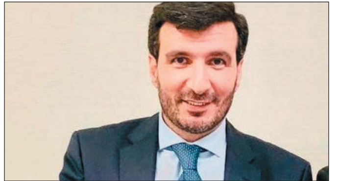
مع اقتراب موعد انطلاق الدوري الممتاز لكرة القدم، تستمر التحضيرات في محاولة لأن يكون الموسم أفضل من سابقه إن كان من النواحي الفنية أو التنظيمية، وفي هذا الإطار تبدو لجنة الانضباط والأخلاق تحت الأنظار بعد