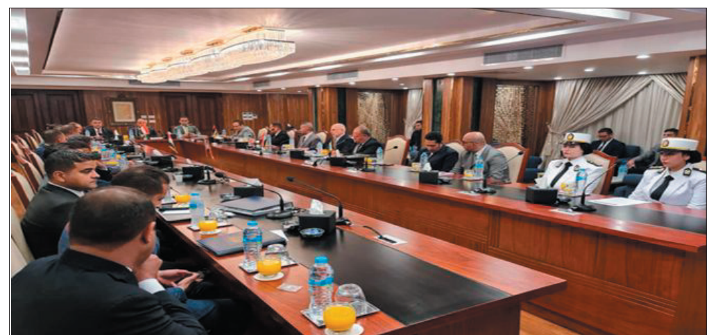
القاهرة - سانا

وأشار اللواء جريج إلى أن سورية كانت وما تزال تلعب دوراً مهماً وفعالاً في دعم جهود المجتمع الدولي لمكافحة المخدرات من خلال الانضمام إلى كل الاتفاقيات الدولية