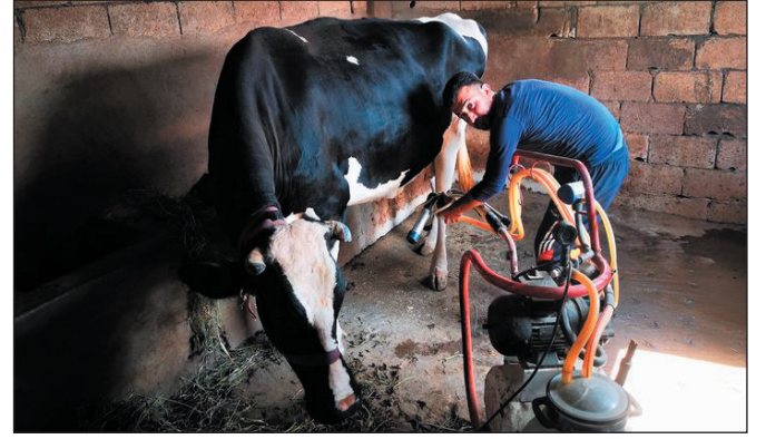
دمشق- حياة عيسى

وفيما يخصّ متطلبات العمل لضمان حسن تنفيذ البرنامج، أشار عرنجي إلى أنها تكمن في تدريب العاملين في الصندوق على دراسة الجدوى الاقتصادية، وتأسيس المشروعات متناهية الصغر وإدارتها وغيرها من المواضيع المتعلقة بالمشروعات متناهية الصغر، والتنسيق بين الجهات المختلفة التي تنفذ المشاريع متناهية الصغر والصغيرة والمتوسطة،