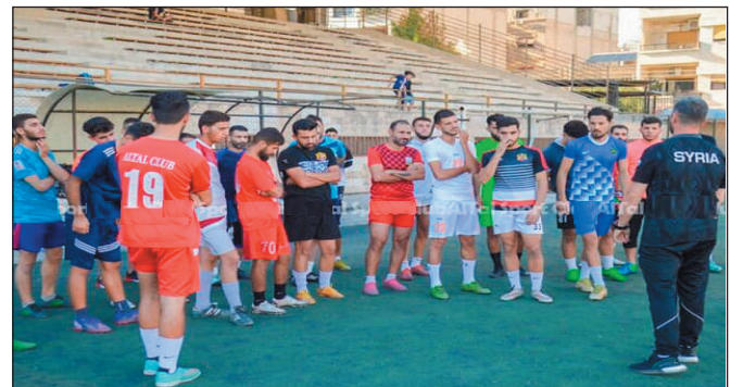
ريف دمشق - المحرر الرياضي