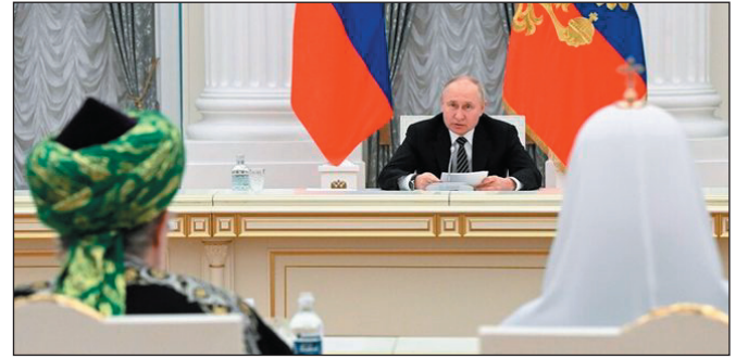
موسكو - نيويورك - سانا

وفي شأن متصل، حذر المتحدث باسم الرئاسة الروسية دميتري بيسكوف