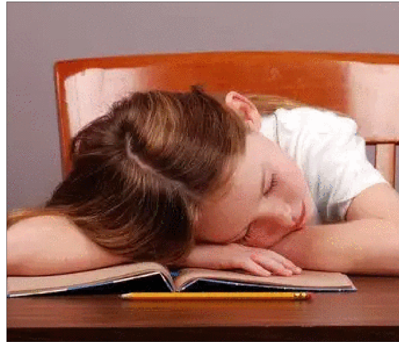
«البعث الأسبوعية» محررة المجتمع