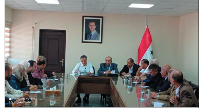
القنيطرة - البعث

بالعملية التعليمية عبر التشاركية وحل المشكلات والاتصال النفسي والاجتماعي بالتلاميذ والطلاب، ومراعاة الفروق الفردية والبيئية والاجتماعية، وتعميق حب الوطن والأرض والخير بنفوس الناشئة، وتعزيز قيم الشهادة والفداء والنضال، لافتاً خلال زيارته مديرية تربية القنيطرة أهمية الارتقاء بالعملية الامتحانية وتطوير آلياتها ومعاييرها، لتتواءم مع النهضة التربوية في المناهج وطرائق التعليم، إذ تعمل الوزارة على إحداث مجلس أعلى تربوي وإمكانية إلغاء الدورة التكميلية للشهادة الثانوية ورفع طبيعة العمل للإداريين والمعلمين بهدف النهوض بالعملية التربوية، مشيراً إلى الاستثمار الأمثل للإمكانات المتاحة المتوفرة، وتذليل بعض الصعوبات التي تواجه العملية التربوية كقص مدرسي اللغات الأجنبية والرياضيات والعلوم، مذكراً بقرارات وزارة التربية التي أعادت المئات من المدرسين المكلفين بأعمال إدارية إلى الصفوف.