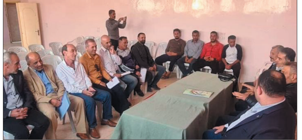
دمشق - المحرر الرياضي تواصل مؤتمرات الأندية واللجان الفنية في مختلف المحافظات انعقادها وسط تفاوت في حجم الحضور ونوعية النقاشات، ووسط الكثير من إشارات الاستفهام

بعض العارفين ببواطن الأمور أكدوا أن اللجان التنفيذية بحد ذاتها وقد يكون أعضاء المكتب التنفيذي كذلك لا يملكون إجابات واضحة عما يطرح في المؤتمرات من أسئلة ومتطلبات، لذلك أشار أحد رؤساء التنفيذيات