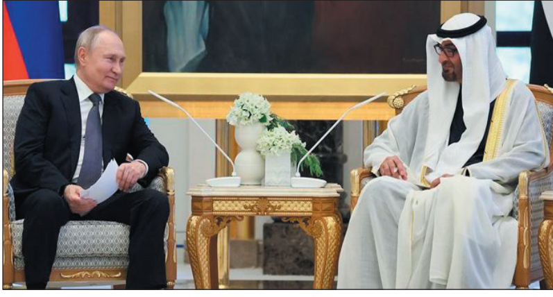
وأشار إلى تطلع الإمارات إلى مواصلة العمل المشترك وتطوير التعاون مع روسيا والتقنيات المتقدمة. في مجالات الطاقة ومشاريع البنية التحتية

أكد الرئيس الروسي فلاديمير بوتين أن الإمارات العربية المتحدة هي أكبر شريك لروسيا، مشدداً على مواصلة تعزيز التعاون بين البلدين في المجالات الإنسانية. ونقل موقع (RT) عن بوتين قوله في محادثات مع الرئيس الإماراتي الشيخ محمد بن زايد آل نهيان في قصر الوطن بالعاصمة أبو ظبي: إن العلاقات بين روسيا والإمارات وصلت إلى مستوى رفيع وغير مسبوق، مؤكداً أن "أبو ظبي هي أكبر شريك تجاري