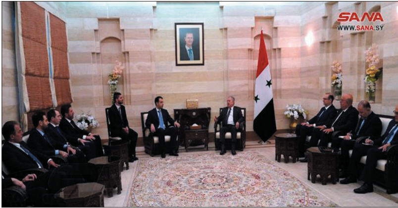
الوزراء الدكتور قيس محمد خضر ومعاون وزير الخارجية والمغتربين مصطفى ديوب.

وضرورة تفعيل دور قطاع الأعمال في البلدين لإقامة مشروعات استثمارية وإنتاجية مشتركة بالاعتماد على الإمكانيات والمقومات المتوافرة لدى الجانبين، وخصوصاً قانون الاستثمار رقم ١٨ لعام ٢٠٢١ الذي يؤمن بيئة استثمار جاذبة في سورية.