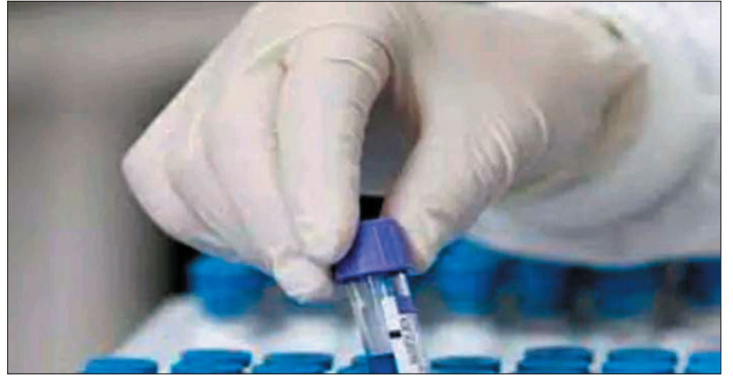
حماة، ولاسيما الهرموني منها، في ظلّ عدم توفر معظمها تشهد التحاليل الطبية ارتفاعاً متصاعداً في محافظة في المراكز الصحية التابعة للقرى والبلدات والتي تقتصر