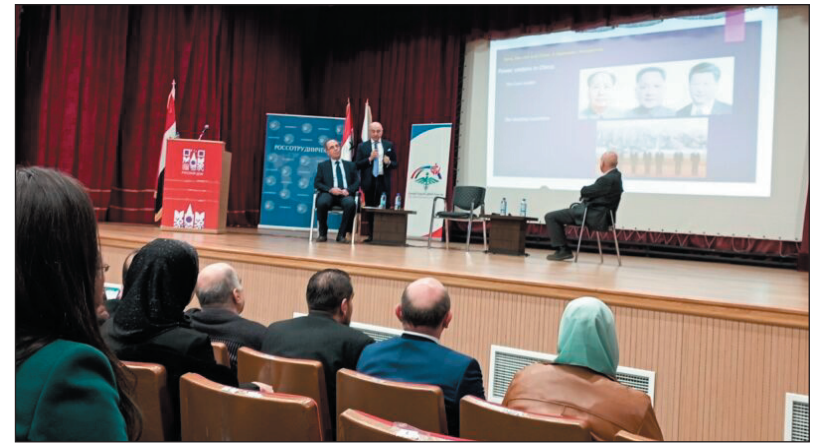
المؤتمر السوري الروسي والرابطة السورية لخريجي الجامعات الروسية تحت شعار تضمنت مناقشات اليوم الثاني من فعاليات