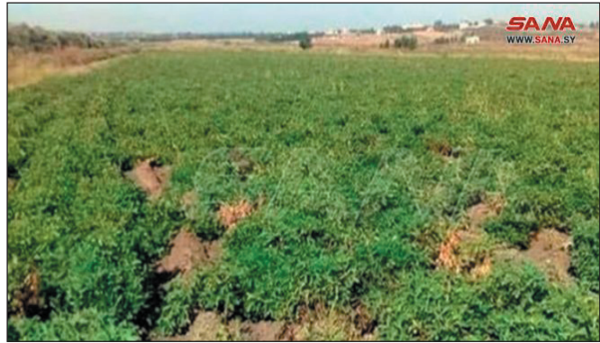
يشار إلى أن المساحة المخططة لزراعة المحاصيل العطرية في محافظة الحسكة للموسم الحالي ٤٣٦٦ هكتاراً.