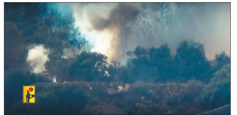
آلية عسكرية للعدو الإسرائيلي في موقع المالكية شمال فلسطين المحتلة وحققت

كما استهدفت المقاومة اللبنانية بعشرات صواريخ الكاتيوشا مستوطنة ميرون شمال فلسطين المحتلة. كذلك استهدفت المقاومة الوطنية اللبنانية مرابض مدفعية العدو الإسرائيلي في عرعر وموقعي بركة ريشا وراميا على